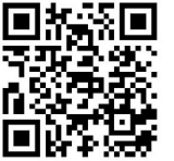
差傳信心認獻 二維碼