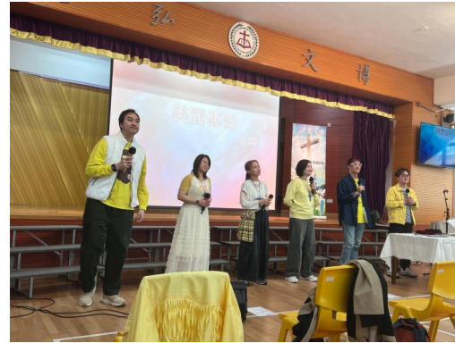
ETERNITY 永恆音樂事工 復活節福音主日